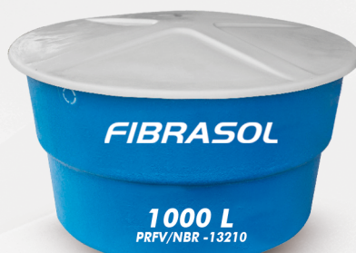
1.000 L BAIXA | 7891341273061