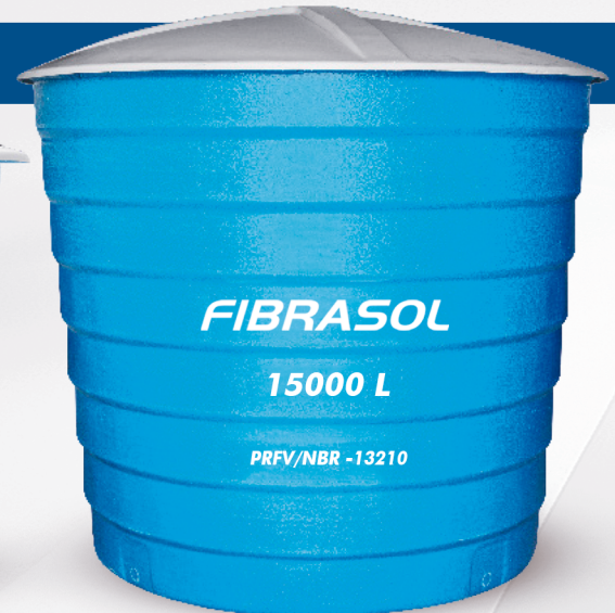
15.000 L | 7891341258310