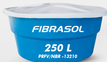
250 L | 7891341910034