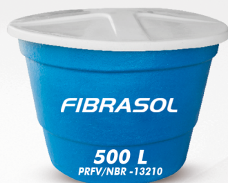
500 L | 7891341689046