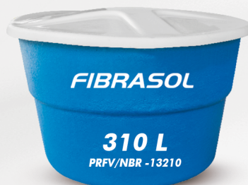
310 L | 7891341907065