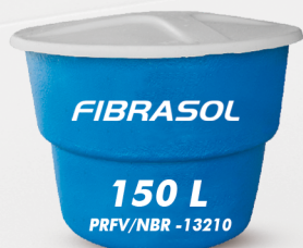
150 L | 7891341890251