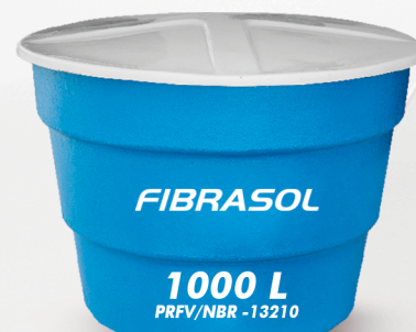
1.000 L | 7891341873094