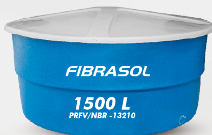
1.500 L | 7891341801004