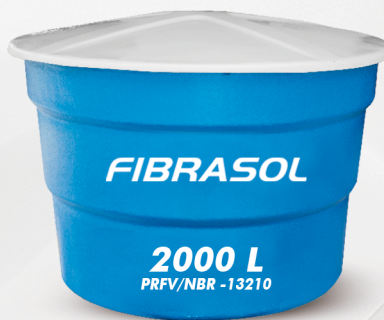
2.000 L | 7891341254336