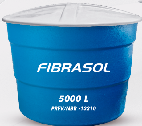
5.000 L | 7891341884878