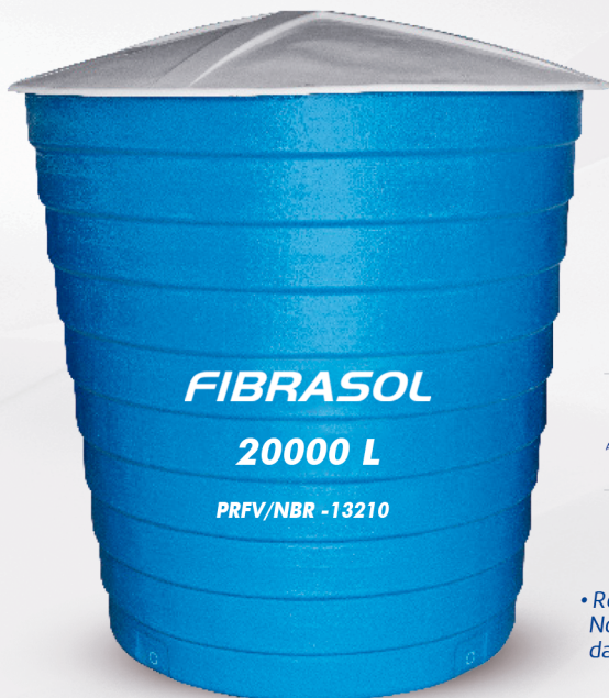
20.000 L | 7891341705494