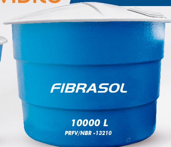
10.000 L | 7891341922068