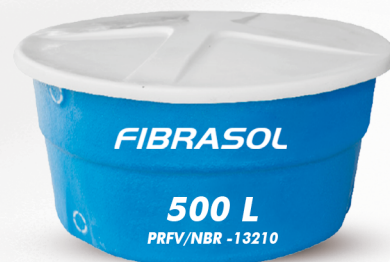
500 L BAIXA | 7891341596658