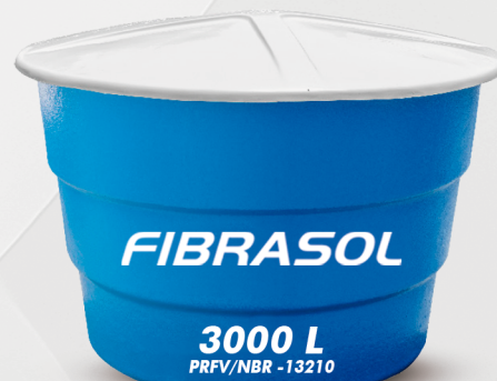
3.000 L | 7891341650688